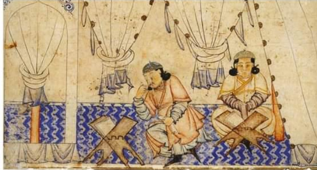
A Mongol prince studying the Koran.

Illustration of Rashid-ad-Din's Gami' at-tawarih. Tabriz (?), 1st quarter of 14th century. Staatsbibliothek Berlin, Orientabteilung, Diez A fol. 70, p. 8 no.1.